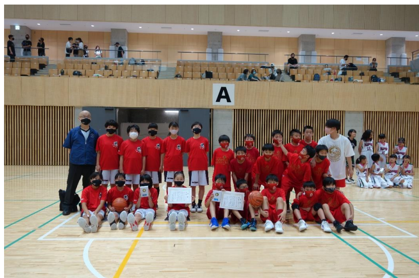
優勝した犬山ミニバス男女チーム