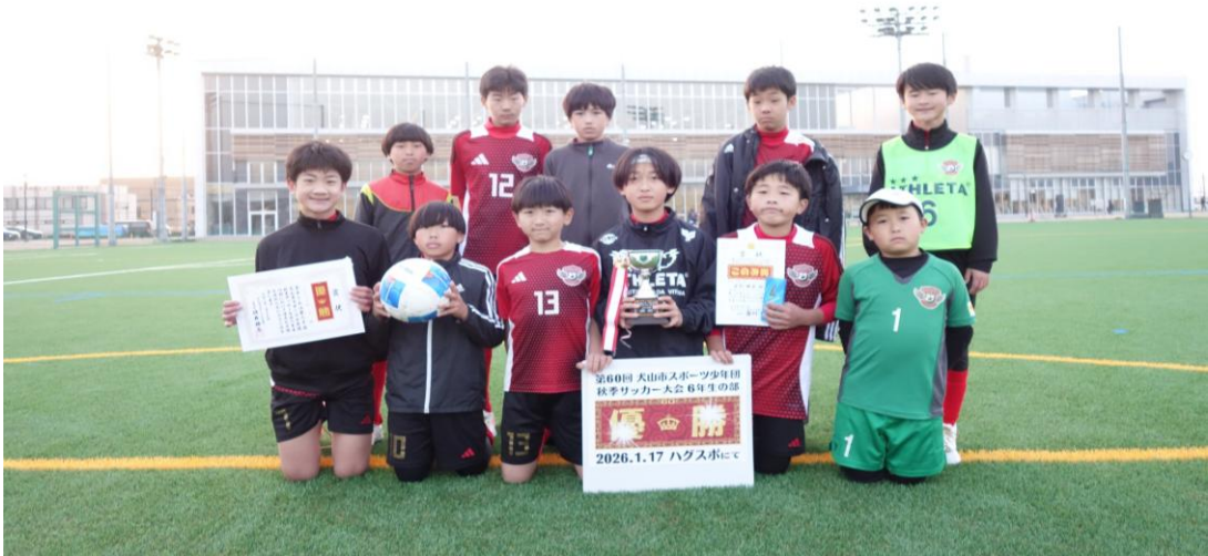
FCフェザーズスポーツ少年団